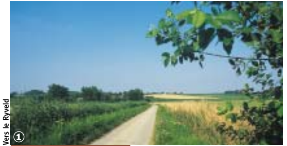
Vers le Ryvelde

Bocage Flamand et marais Audomarois, au fil de l'Yser