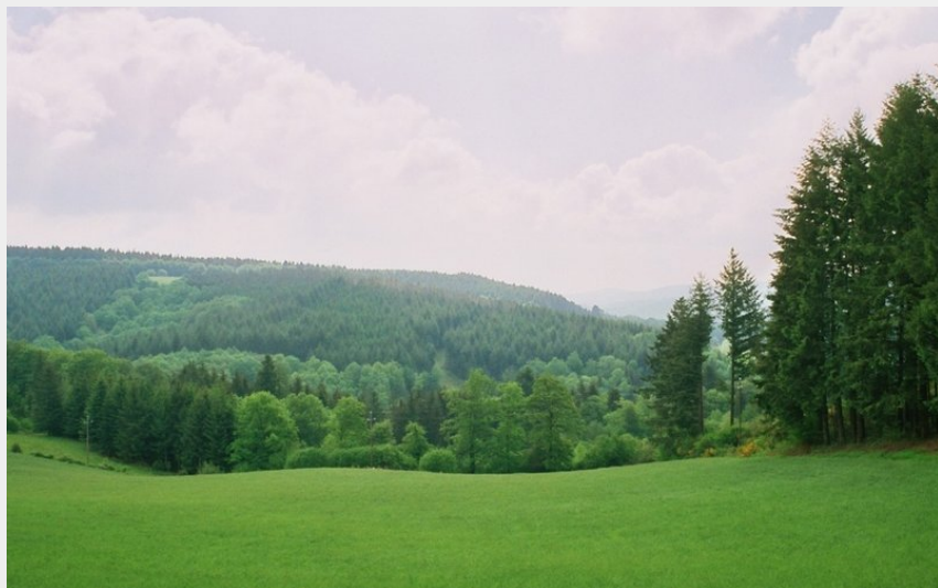
Paysage Brassac (sidobre tourisme)