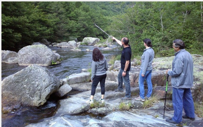
Sentier du Camboussel Brassac