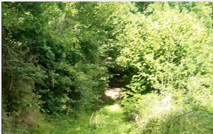
sentier bois du prince (sidobre tourisme)