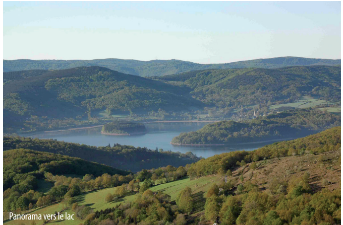
Panorama vers le lac

Autour du Lac du Laouzas, le Roc du Montalet alimente souvent les conversations. Là-haut, par dessus les landes rases et les hêtres tordus, il est un indicateur précieux des caprices du temps.