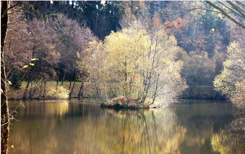
Lac de la Broussonnié variante circuit du barrage